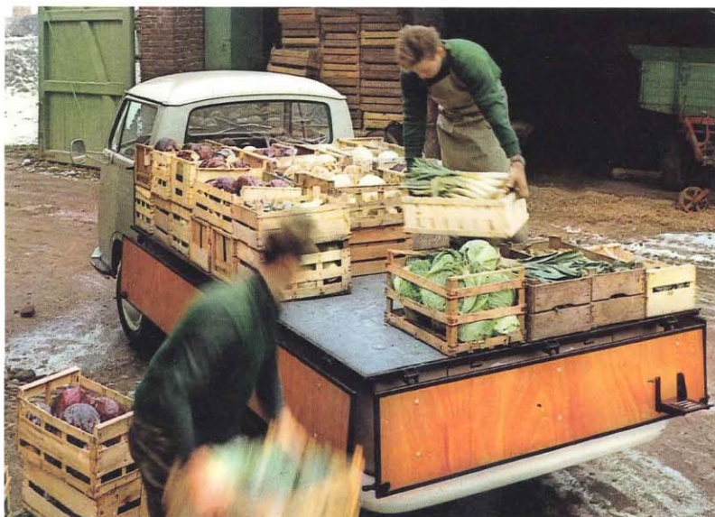
Le pick-up à plateau élargi. Surface utile: 5,2 m 2 . Charge utile: 920 kg. Un plateau de charge encore plus grand que le précédent (2,82 x 1,85 m). Si vous devez transporter des marchandises aussi encombrantes qu'une armoire normande.