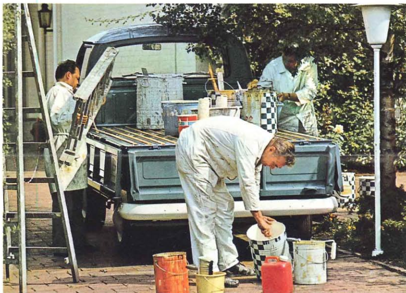
Le pick-up VW. Surface utile: 4,3 m 2 . Charge utile: 1 tonne. Une cabine à 3 places avec une vaste lunette arrière; une soute verrouillable de 0,7 m 3 . Et un plateau de charge, strié de lattes en bois dur, dont on peut rabattre les ridelles et le hayon. Sa hauteur (98 cm du sol) permet de charger et décharger sans fatigue.