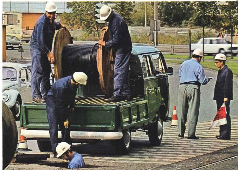
Le pick-up double cabine. Surface utile: 2,9 m 2 . Charge utile: 950 kg. Places: 6 personnes. A l'avant, c'est une voiture de tourisme, avec des banquettes confortables et un siège individuel pour le conducteur. En ôtant la banquette arrière, on dispose d'un compartiment de 1,8 m 3 . A l'arrière, c'est un pick-up avec un plateau de charge (1,85 x 1,57 m) aux côtés rabattables.