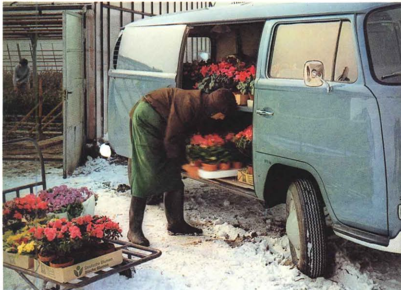
La camionnette VW. Volume utile: 5 m 3 . Surface utile: 4,4 m 2 . Charge utile: 1 tonne. Si vous devez faire des "arrêts fréquents" pour vos livraisons: sur le côté, une porte coulissante (122,5 x 106 cm) qui s'ouvre facilement et reste ouverte grâce à un cran d'arrêt. A l'arrière, une porte relevable (123 x 73 cm) qui peut rester ouverte quand vous roulez.