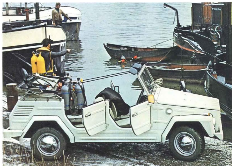
La VW 181. Sa suspension lui permet de rouler sur n'importe quel terrain. Ses 53 CV lui font grimper des côtes de 48,5 %. Elle est équipée pour les conditions les plus difficiles. C'est la voiture incassable de ceux qui doivent passer partout. Elle a un coffre à l'avant, un emplacement pour les bagages derrière la banquette arrière (dont les dossiers séparés peuvent être rabattus pour faire une plate-forme de chargement).